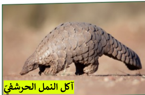
آكل النمل الحرشفي