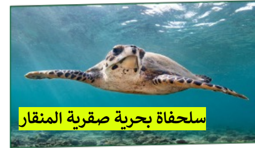
سلحفاة بحرية صقرية المنقار