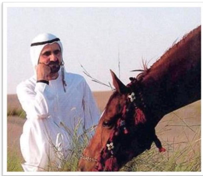
谢赫·穆罕默德·本·拉希德·阿勒马克图姆殿下