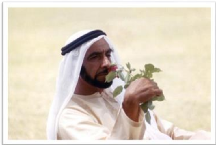
谢赫扎耶德·本·苏丹·阿勒纳哈扬 (愿他的灵魂安息)