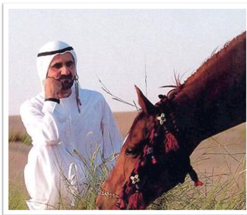
Son altesse Cheikh Mohammed bin Rashid Al Maktoum