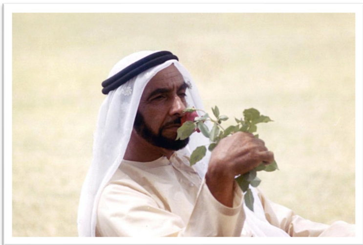
Feu Cheikh Zayed bin Sultan Al Nahyan

Lire les extraits de poèmes émiratis et rechercher les références en lien avec la nature.